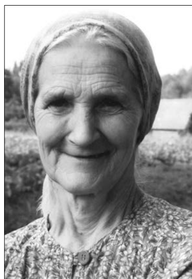
Na zdjęciu: Polka z Łotwy.

Obecnie w Oddziałach ZPŁ funkcjonuje kilka zespołów i chórów promujących kulturę polską. W Jelgawie działają zespoły wokalne „Stokrotki” i „Słowiczek”, w Jēkabpils zespół wokalny „Rodacy”, w Lipawie zespół wokalny „Bursztyński”, w Krasławiu – „Strumień”, w Lucynie – „Czerwone korale”. W Rzeżycy istnieje chór „Jutrzenka”, a w Dyneburgu – chór „Promień” oraz młodzieżowy Zespół Tańca Ludowego „Kukuleczka”.