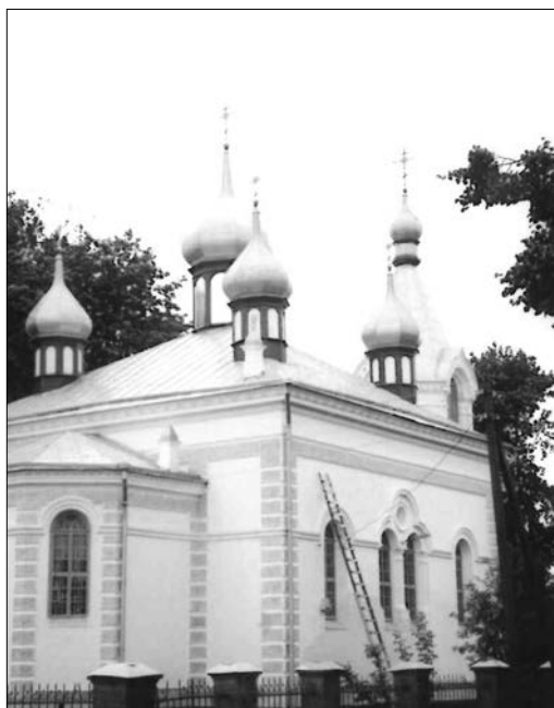
Na zdjęciu: Cerkiew prawosławna w Brastawiu

małych, drewnianych, zszarzałych już od starości drewnianych chatynek. Mieszkają w nich prawie sami staroobrzędowcy. Świadczą o tym małe drewniane sauny stojące obok każdego domostwa.