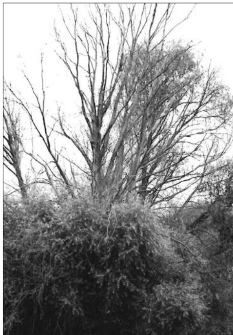
Na zdjęciu: Chaszczce w Bułowiskach