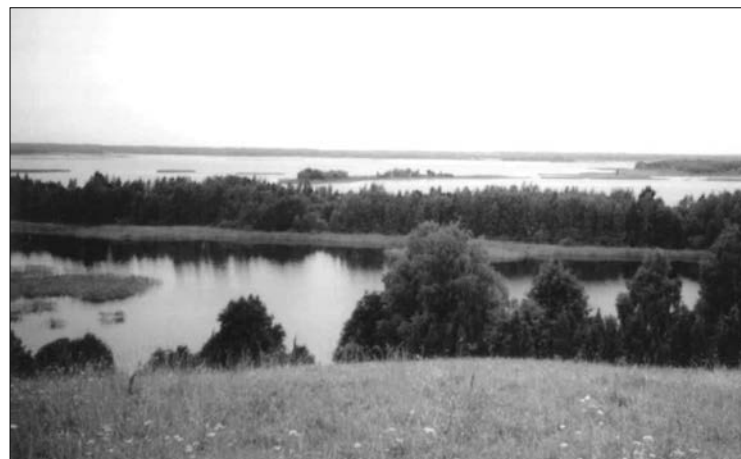
Na zdjęciu: Jezioro Snudy

Trzeba na górę koniecznie wejść, bo to najwyższe wzniesienie Brasławia, stamtąd ma się miasto jak na dłoni. Szczyt Góry Zamkowej ma przekrój ogromnej niecki o średnicy przynajmniej stu metrów, otoczonej po obwodzie wieńcem wału ziemnego. Gdy stąpamy