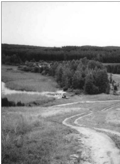
Na zdjęciu: Panorama widziana z wieży widokowej