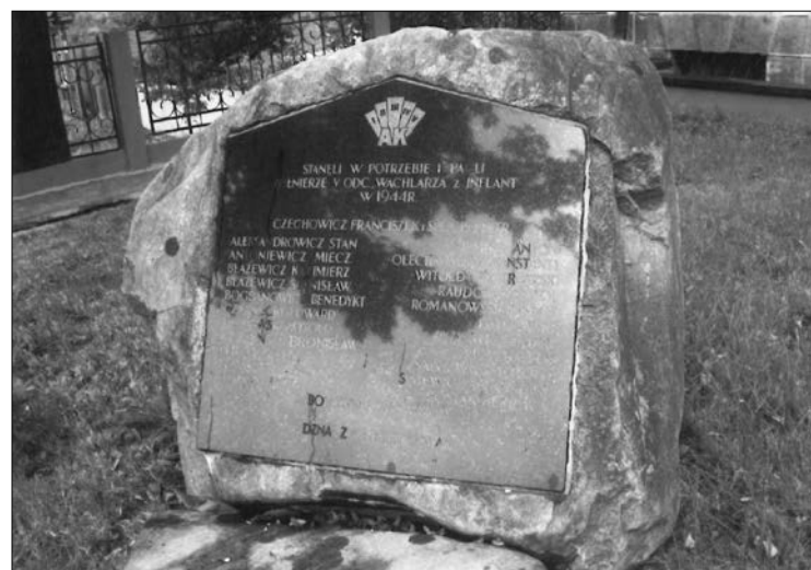
Na zdjęciu: Tablica pamiątkowa żołnierzy AK przed Domem Polskim w Dyneburgu.

Pod koniec lat osiemdziesiątych powstało również Polskie Towarzystwo Społeczno-Kulturalne.