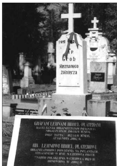
Na zdjęciu: Symboliczny Grób Nieznanego Żołnierza z walk 1919-1920 na cmentarzu rzymskokatolickim w Dyneburgu.

rozpoczynających nierzadko od prześladowania mniejszości.